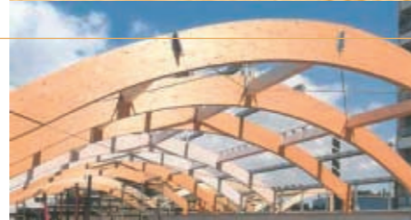
Constructies voor industriehallen